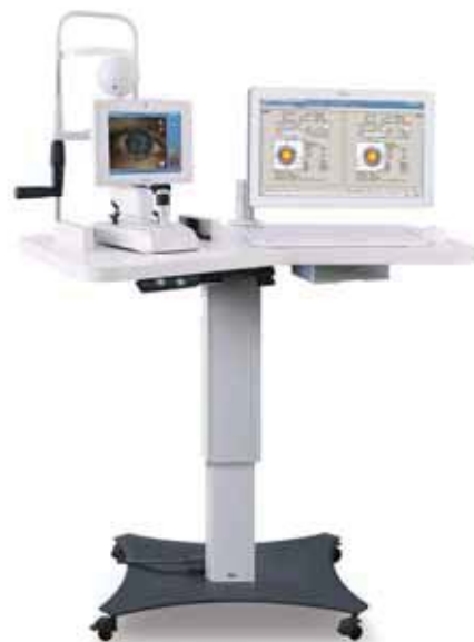
アルコン社ベリオン®

最先端の術中眼球追尾機能を備えた アルコン社のベリオン® を導入しました。 外来での検査データを手術中の眼球にリアルタイム で投影することにより、とても 再現性の高い手術 が可能 です。